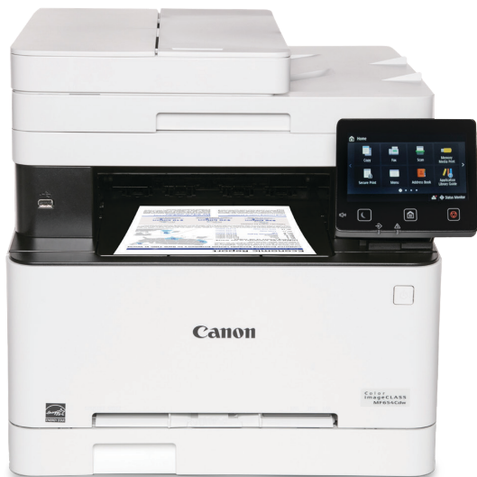
Color imageCLASS MF654Cdw